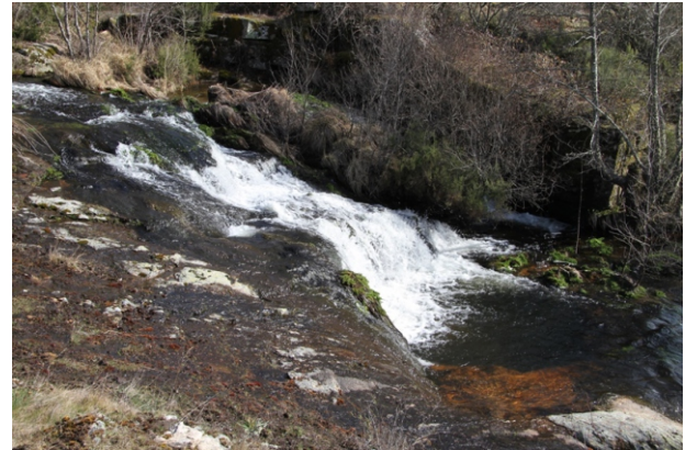
Pequena ferverza e área recreativa no río Parro ou das Veigas.