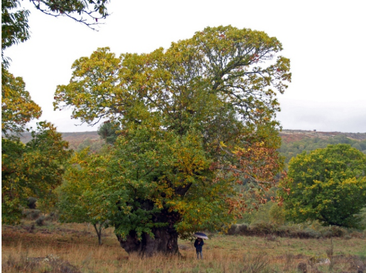
Castiñeiro da Ribeira en Manzalvos. Ten un perímetro de case 11 m. Atópase nun prado á esquerda da estrada que vai de Manzalvos a Chaguazoso, un pouco despois de saír da localidade e antes de chegar ao río. Está incluído no catálogo de árbores senlleiras de Galiza.