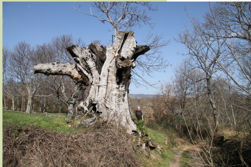
O Mola. (Chaguazoso). de 9,4 m de perímetro. Está incluído no catálogo de árbores senlleiras de Galiza, pero está case seco.