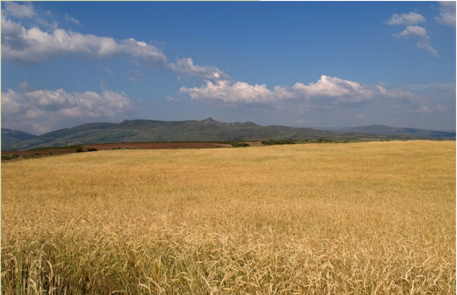
Paisaxe da Mezquita onde se aprecian os perfís suaves dos montes e os campos de centeo. O centeo é o único cultivo que ocupa extensións importantes nesta zona.