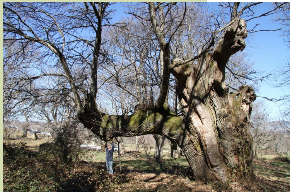
Castiñeiro en Chaguazoso. Este castiñeiro de 9,2 m de perímetro atópase no souto que hai ao pé do cemeterio de Chaguazoso á esquerda da estrada que vai á Esculqueira.