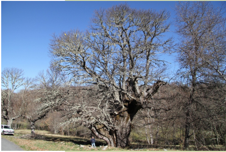
Castiñeiro das Necas ou do Prado da Ponte. Ten case 10 m de perímetro. Atópase ao pouco de empezar o camiño do Penedo dos Tres Reinos, á esquerda da pista. Está incluído no catálogo de árbores senlleiras de Galiza.