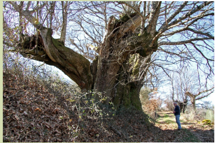
Castiñeiro do souto dos Trogais. Ten 10,80 m de perímetro. Para velo hai que subir polo camiño que se atopa xusto ao pé do indicador do Penedo dos tres Reinos, ao pasar a ponte. Atópase na parte alta do souto tamén á esquerda do camiño. Antes de chegar a el hai outro, de dous brazos, de máis de 9 m de perímetro. Está incluído no catálogo de árbores senlleiras de Galiza.